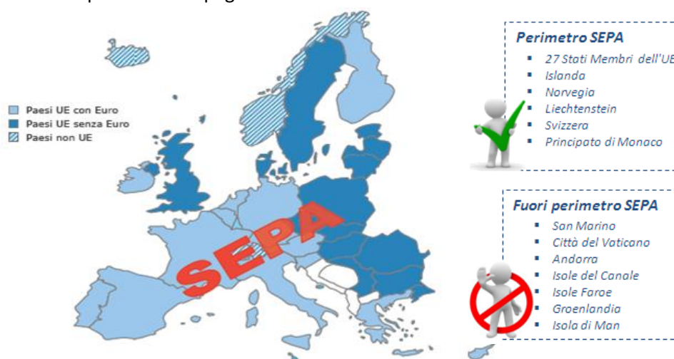
Figura 1. I paesi aderenti alla SEPA

La SEPA ricomprende tutti i pagamenti in euro effettuati all'interno di 32 1 Paesi: